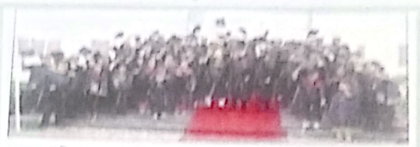
दीक्षांत समारोह में उपाधि प्रदान कर चुकी छात्रों का दृश्य।